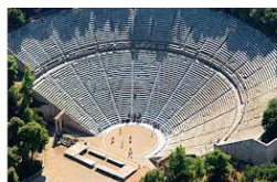
THÉÂTRE D'ÉPIDAURE PATRIMOINE MONDIAL DE L'UNESCO