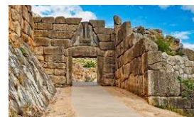
MYCÈNES PATRIMOINE MONDIAL DE L'UNESCO