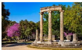
SITE ARCHÉOLOGIQUE D'OLYMPIE PATRIMOINE MONDIAL DE L'UNESCO