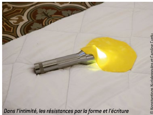
Dans l'intimité, les résistances par la forme et l'écriture